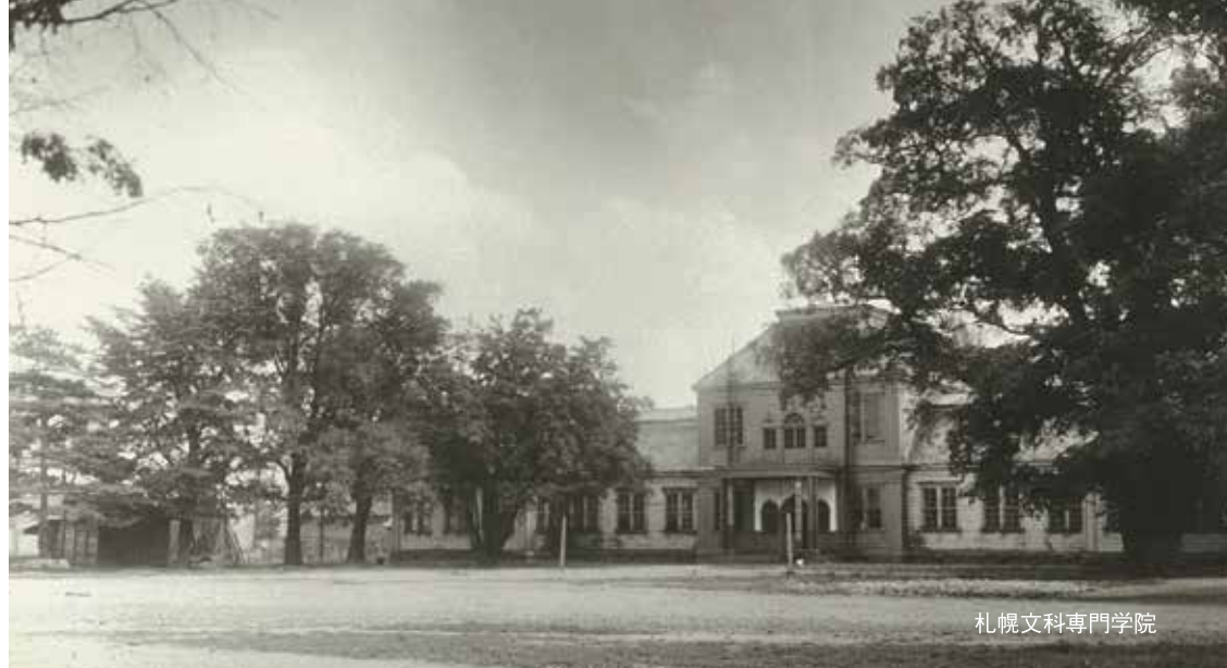
札幌文科専門学院