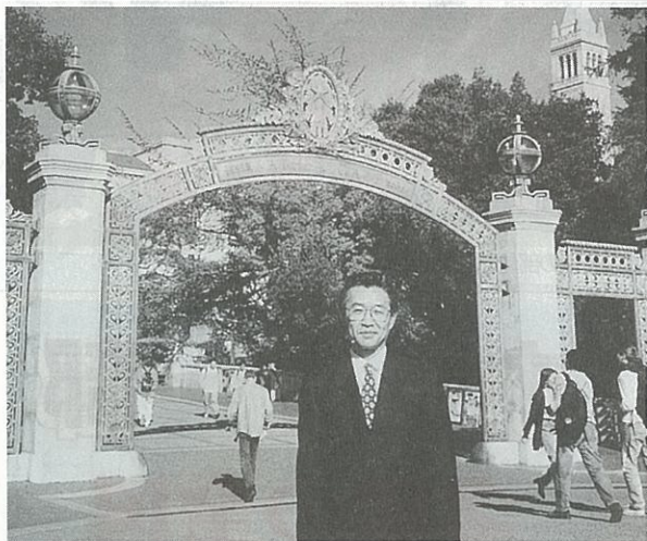
セイザー・ゲートと時計台セイザー・タワーを背景にして

博士(経営学) 明治大学から授与論文テーマ「日本の経営とオフィス・マネジメント——ホワイトカラー管理の形成と展開——」