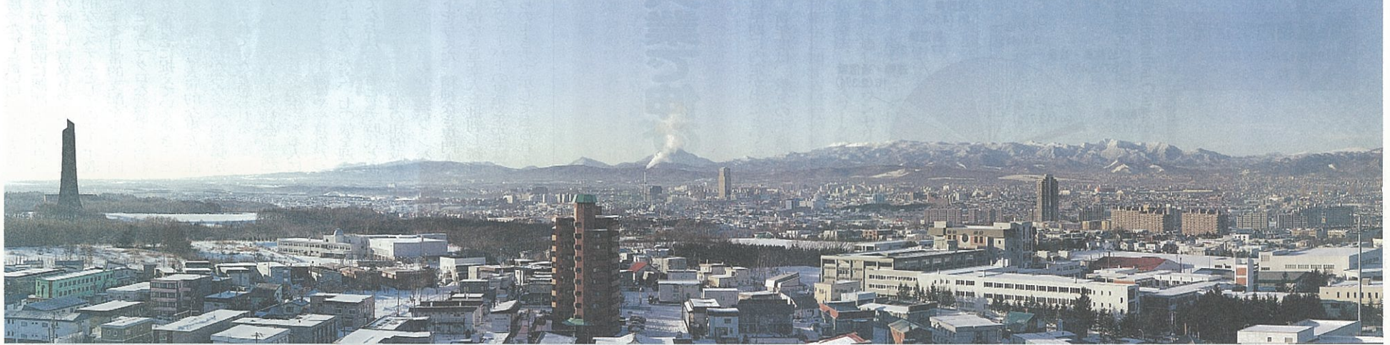
G館(50年記念館)8階ラウンジより札幌・江別市内を見渡す。左側が野幌森林公園。遠くには樽前山も姿を見せる

ステージは40人程度の演奏が可能。中央は文泉会(同窓会)より寄贈された緞帳「石狩の野に昇る」。デザインは藤倉英幸氏。50年記念館SGUホール