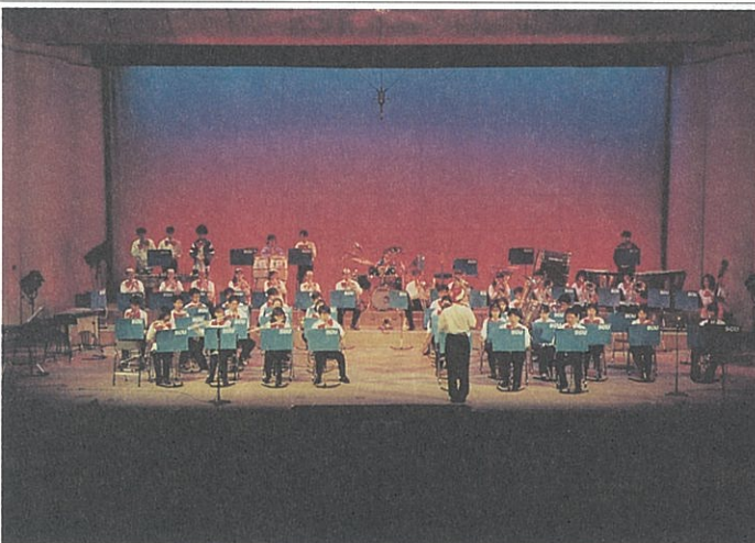
聴衆を魅了した「第17回定期演奏会」

吹奏楽団は、現在四十名を超えるメンバーで幅広い活動を展開し、演奏技術の水準を向上させるため日々練習を積み重ねている。 六月、札幌地区の七大学が合同で主催するバンドフェスティバルに参加し、七月には学内コンサートや、文京台家族大運動会でのアトラクション演奏を行い、地域住民に好評を博した。 夏休みには演奏技術の向上と交流を深めることを目的とした合宿を白老で行い、その成果もあって、八月の北海道吹奏楽コンクール札幌地区大会(一般の部)に出場では、「金賞」に輝いた。 この他にも硬式野球部の大会での応援演奏、大学祭や学外でのボランティア演奏会等、忙しいスケジュールをこなしている。 十二月二十一日には年間活動