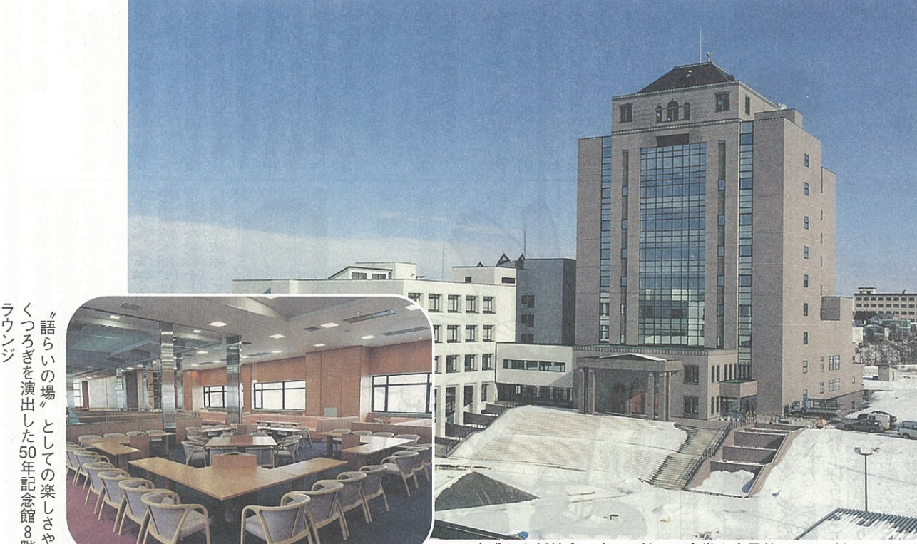
完成した新校舎。右のG館には食堂や多目的ホールがある。