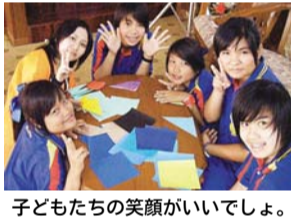
子どもたちの笑顔がいてほしい。