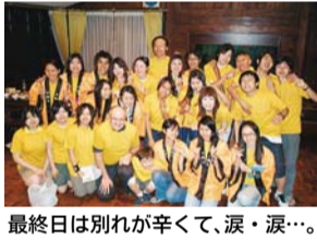
最終日は別れが辛くて、涙・涙...