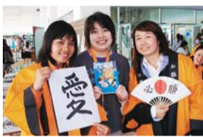
日本文化の紹介はどれも大好評でした。