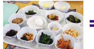
ここから副菜どれでも二品