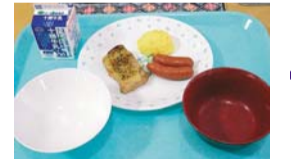
ごはん、味噌汁、主菜、牛乳

人口の十%近くを学生が占める北海道江別市。「一日を気持ちよくスタートする近道は朝食にあり」と、市内四大学・三短大は「春の食生活改善運動」を