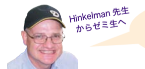
Hinkelman先生からゼミ生へ

I hope this is the biggest challenge in four years at SGU—a tough and great experience.