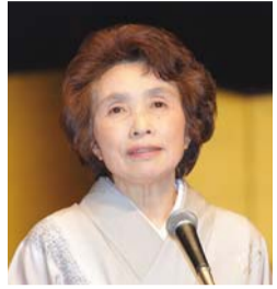
平成20年度入学式にて