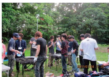
ゼミでのバーベキュー