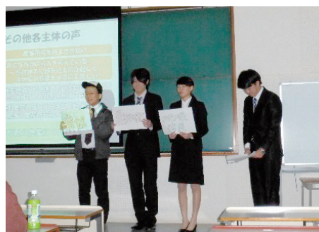
釧路公立大学でのSCANの発表会

経済学部では1年生から4年生までゼミが配置されています。1年生のゼミでは経済学の基礎的なことを勉強しますが、2年生以降のゼミはより専門的なテーマについて勉強します。ただ教室で勉強するだけでなく、フィールドワークや工場見学、他大学との研究発表会に参加するゼミもあります。このほかに合宿なども行い、教員学生間の人間的交流をはかります。