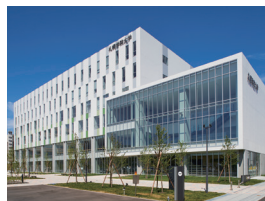
新札幌キャンパス