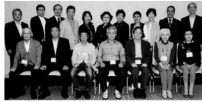
札幌短期大学18期第7回同期会 平成30年9月29日 於札幌第一ホテル

・出席者数18名 ・3年ぶり7回目の開催。50年前に戻り、賑やかで楽しい時間を過ごしました。