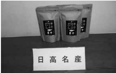
「海と山のめぐみだし」大学祭に協賛