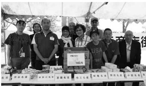
まもなく開店です