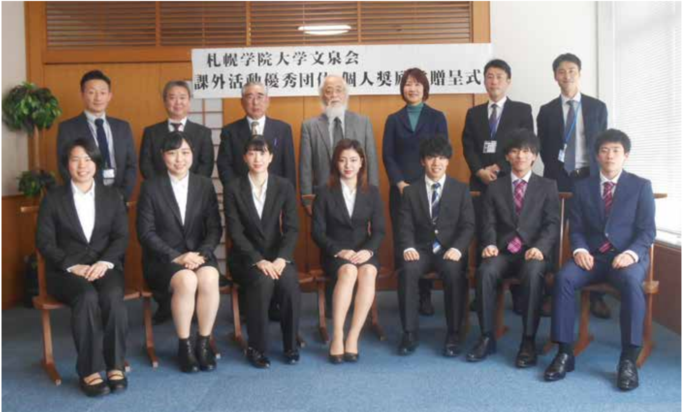
平成30年度学生課外活動表彰 平成30年度中に全道・全国大会において好成績を収めた 団体・個人が表彰されました。

札幌文科専門学院・札幌短期大学・札幌商科大学・札幌学院大学同窓会 http://www.sgu.ac.jp/bunsen1/