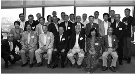
各支部代表と教職員

その後の親睦交流会では、大学職員・役員と本学に対する意見交換を行い、親睦を深めました。