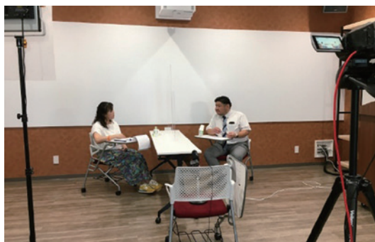
「地域で支える認知症」収録風景