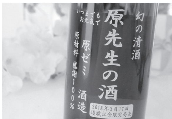
卒業時、恩師に贈った思い出のプレゼント

こうして学生時代を振り返ってみると懐かしいものばかりです。隣の森林公園、百年記念塔、大麻駅、学食等思い出します。そういえば先月、学食のチキン竜田丼をいただきました。たまには皆さんも大学でランチでもいかがでしょうか。大学時代の友人、サークルのみんな、ゼミナールで大変お世話になった先生の執筆を読んだきっかけに連絡を取ってみてはいかがでしょうか。きっと楽しかった学生時代を思い出せますよ。ここまで読んでいただきありがとうございます。一緒に頑張っていきましょう。